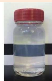
NaCL=3%添加時の外観写真