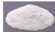
プレミックスタイプ