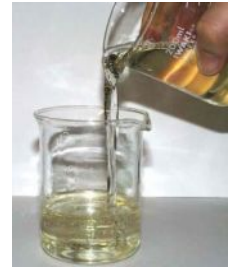
ハンドリング性の高い液状原料

★ 洗浄製品における優れた増粘剤。 液状でハンドリングが良い。 粘度だけでなく増泡も併せ持つ。