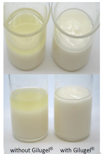
without Gilugel® with Gilugel®