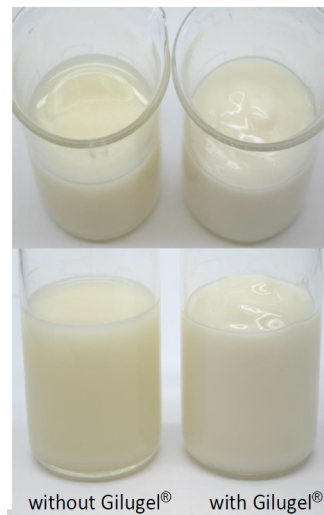
without Gilugel® with Gilugel®

制酸剤(医薬品)として使用されている ヒドロタルシトやマ ガルドレートと同じ レイヤー格子構造