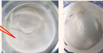
Matrifuse™ S-1あり Matrifuse™ S-1なし