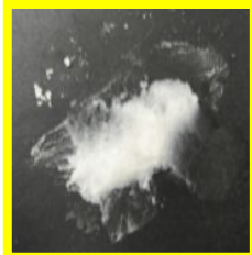
Lipex Shea 常温

最もベーシックな、半固体のシアバターです。 低臭、低結晶性の高精製バター です。