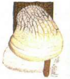
マッシュルームエキスを得るのに使用される東欧のエブリコ

LARICYL LS 8865は、一般的に Polyporus officinalis とも呼ばれているエブリコ(学名: Fomes officinalis )というサルノコシカケ科のキノコから得られるエキスです。この巨大なキノコは円錐形で黄色や茶色の斑点のある硬い環状の殻に覆われ、カラマツの樹皮に背着し成長する植物です。