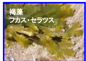
褐藻 フカス・セラツス

② ホメオシールド (Homeo-Shield) は褐藻フカツセラツス ( Fucus seratus )から抽出されます。フカツセラツスは欧州の一部の地域では古くからスキンケアに用いられており、美の海藻としての由来があります。