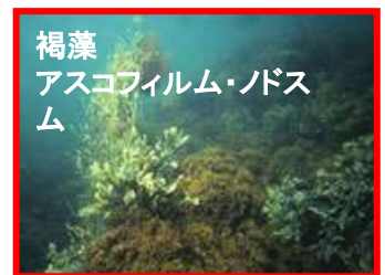
褐藻 アスコフィラム・ノドスム

② ホメオシールド (Homeo-Shield) は褐藻フカツセラツス ( Fucus seratus )から抽出されます。フカツセラツスは欧州の一部の地域では古くからスキンケアに用いられており、美の海藻としての由来があります。