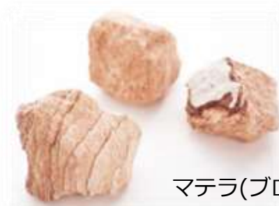
マテラ(ブロック状)