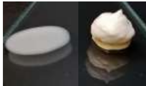
無配合 (Unstable) 5% BENTONE HYDROCLAY™ 1100