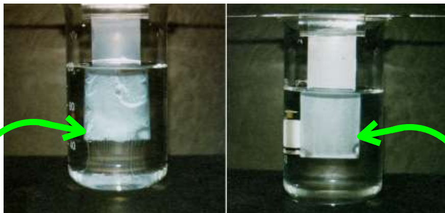
ノニオン系(EO付加)乳化剤