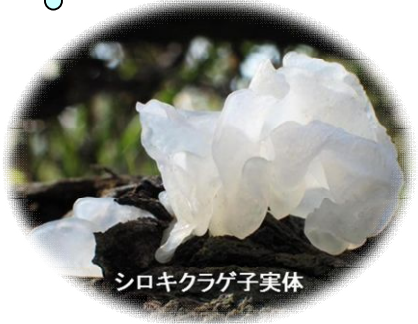
シロキクラゲ子実体